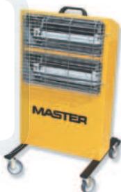
HALL 3000 C